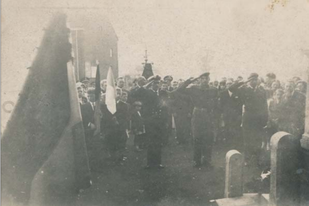
Hulde aan het monument van de oud-strijders