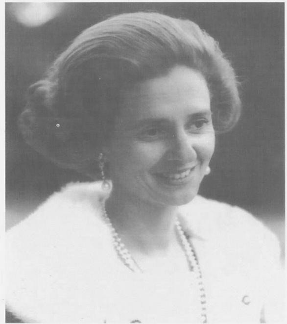
Hare Majesteit Koningin Fabiola Sa Majesté la Reine Fabiola Ihre Majestät Königin Fabiola 1928 - 2014